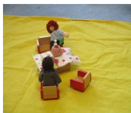
Bild: Geschichtensäckchen Geburtstag